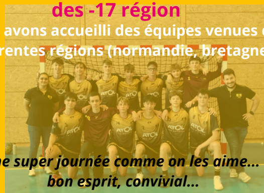
Une super journée comme on les aime... bon esprit, convivial...

Nous avons accueilli des équipes venues de différentes régions (normandie, bretagne).